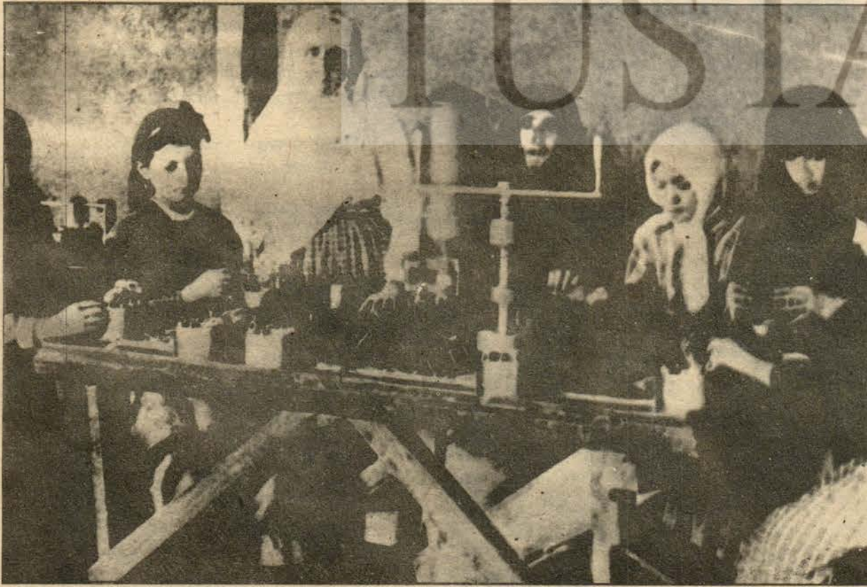
Kurtuluş Savaşında genç kızlar, kadınlar, nicelet kendi elleriyle ocahana yapıyorlar.

«Burjuvazi açısından Türk bağımsızlık savaşı, ay-