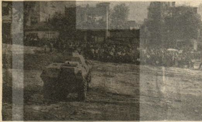
Berec Fabrikasında direnişteki işçilere saldıran panzer...

Sendika hürriyeti, iş güvenliği ve kadın işçilere yapılan sarkıntılıkların önlenmesi için direnişe geçen Berec işçilerinin mücadelesi bu seferlik kırılmıştır. Fakat işçiler bu mücadeleden önemli dersler çıkarmışlardır. Faşist MC iktidarının ve patronun emrindeki polislin, vahşice saldırısı işçileri daha da çelikleştirdi. İşçiler, bu mücadele ile gördüler ki, polis, patronun fedaisidir. Yine işçiler kendi deneyleriyle gördüler ki, eğer kararlı bir şekilde birlik olup, kendi gücümüze güvenerek karşı koyarsak polis geriletebilir. Yine işçiler, sendikaların yönetimine tabandaki gerçek işçiler hakim olmadıkça direnişin yarı yolda bırakılacağını gördüler. Pancar Motor işçileri Berec işçileri destekleyerek, işçi kardeşliğinin ve dayanışmasının en güzel örneğini verdiler.