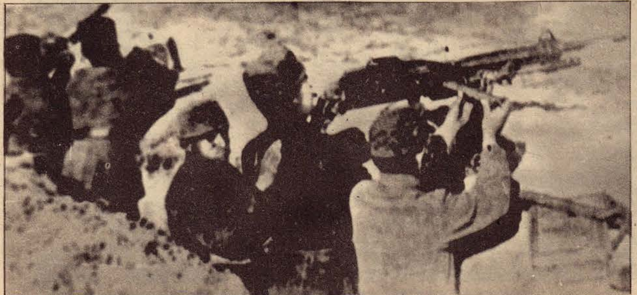
kurtuluş savaşında çarpışan askerler