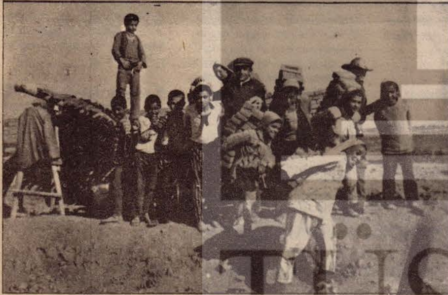
Diyarbakır'daki tuğla ocağında çalışan çocuklar