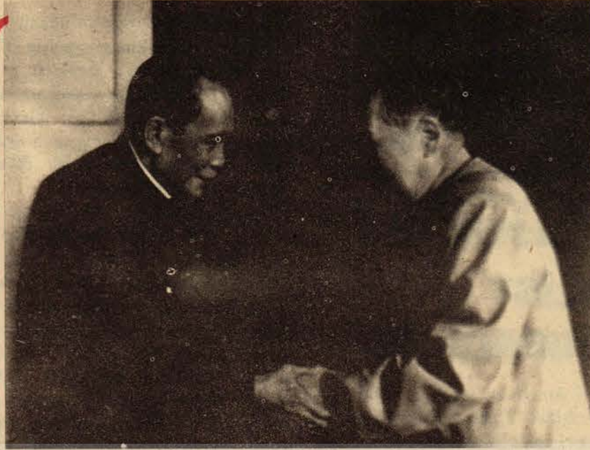
Mao Zedung ve Kamboçya Başbakanı Pen Nut el sıkışırken