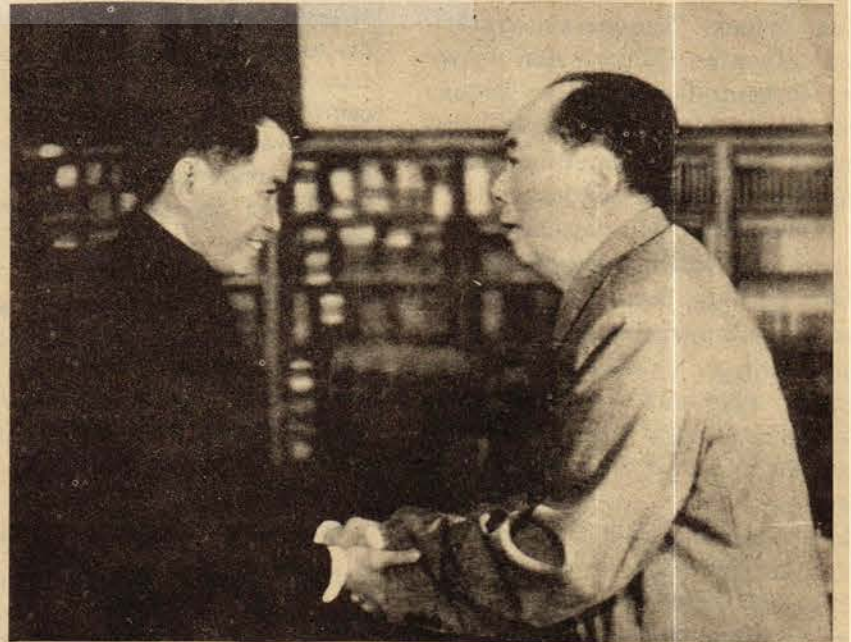
Mao Zedung Başbakan Yardımcısı Kiyō Sampan ile

«Kamboçya tarafı, seçkin önderi Başkan Mao olan Çin Komünist Partisinin dirayetli ve doğru yönetimi altındaki Çin halkının sosyalist devrim ve sosyalist inşada durmadan kazandığı büyük zaferlerden sevinç duyar ve en sıcak tebriklerini belirtir. Halkın millî kurtuluş mücadelesini sosyal dava ile tamamlama mücadelesindeki Kamboçya halkı, Başkan Mao Zedung'un dirayetli önderliğindeki Çin Komünist Partisinin, Çin Hükümetinin ve kardeş Çin halkının enternasyonalist ilkelere göre verdikleri samimi yardımı almış bulunmaktadır. Kamboçya milleti ve hal-