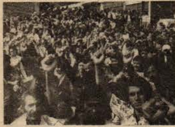
Kapak resmi: Direnen Berec işçileri

İcabında kızla oğlan birbirlerini sevseler dahi müsaade etmezler köy ağaları. Herhangi bir fakir köylü çocuğu evleneceği zaman ağaya haber verir, eğer ağa müsaade ederse evlenebilir.